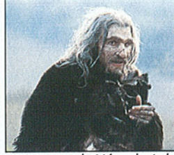
Homme de Néandertal

20.40 00 Neandertal. Docu-fiction réalisé par Tony Mitchell. (1/2). La vie quotidienne et difficile de Néandertal, le cousin de l'homme actuel, dont la disparition voici 35 000 ans demeure une énigme. T 5056979 21.35 360°, le reportage GEO. Magazine. Les métaux de Chicago. 22.30 Les Ballets C. de la B. par-ci par-là. 00 Documentaire réalisé par Alain Platel. Une présentation de la compagnie des Ballets C de la B, collectif de danse et de théâtre fondé à Gand il y a plus de vingt ans par des artistes passionnés. 22134 23.25 Metropolis. 0.20 Königsberg est morte. 1.35 00 La digue. Téléfilm (2003, 80 mn).